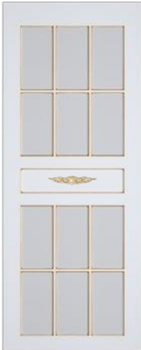
«Версаль» - стекло с декором