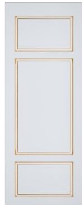
«Версаль 2» - глухая

Тип «Версаль» - возможно дополнение декором.