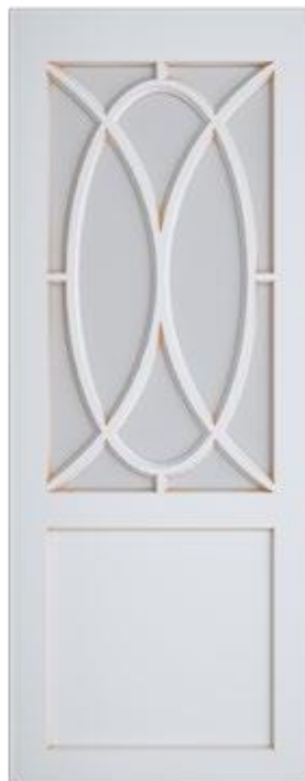
«Рим» - стекло/глухая

* По высоте меняется только верхняя часть двери, высота нижней части остается неизменной.