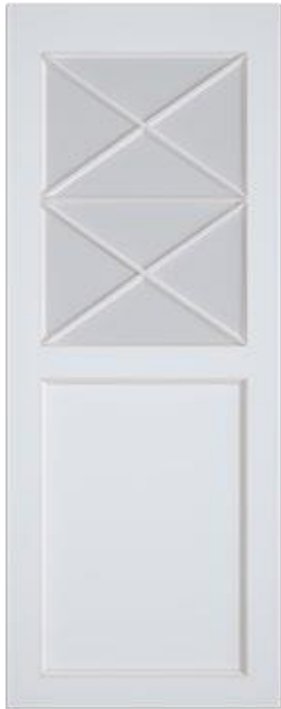
«Прованс» - стекло/глухая