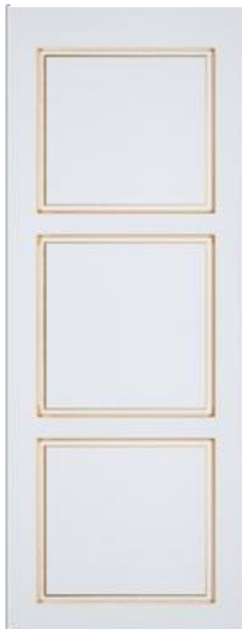
«Версаль 1» - глухая