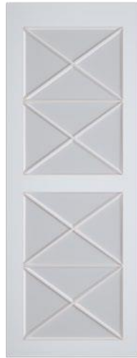
«Прованс» - стекло

* По высоте меняется только верхняя и нижняя часть двери, высота центральной части остается неизменной.