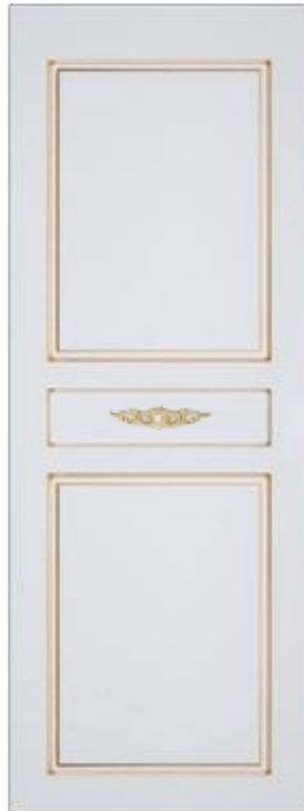
«Версаль» - глухая с декором