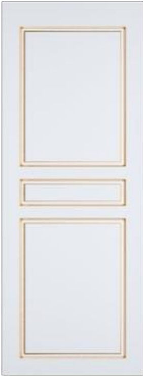
«Версаль» - глухая