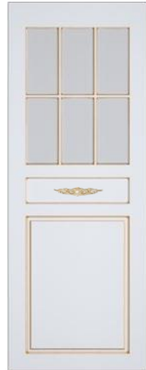
«Версаль» - стекло/глухая с декором